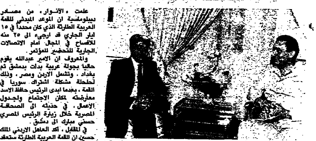
بغداد يستقبل طارق عزيز

الحسين التقى الامير عبدالله وشدد على عقدها في بغداد ارجاء القمة العربية الى ٢٥ الجاري للتشاور فيما طالبت سوريا باجتماع لوزراء الخارجية